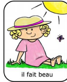
il fait beau