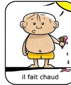
il fait chaud