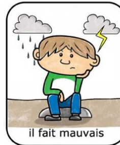
il fait mauvais