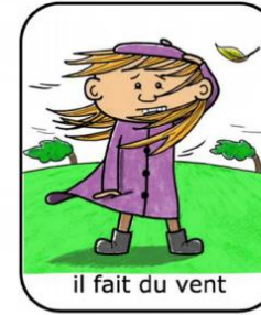
il fait du vent