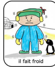
il fait froid